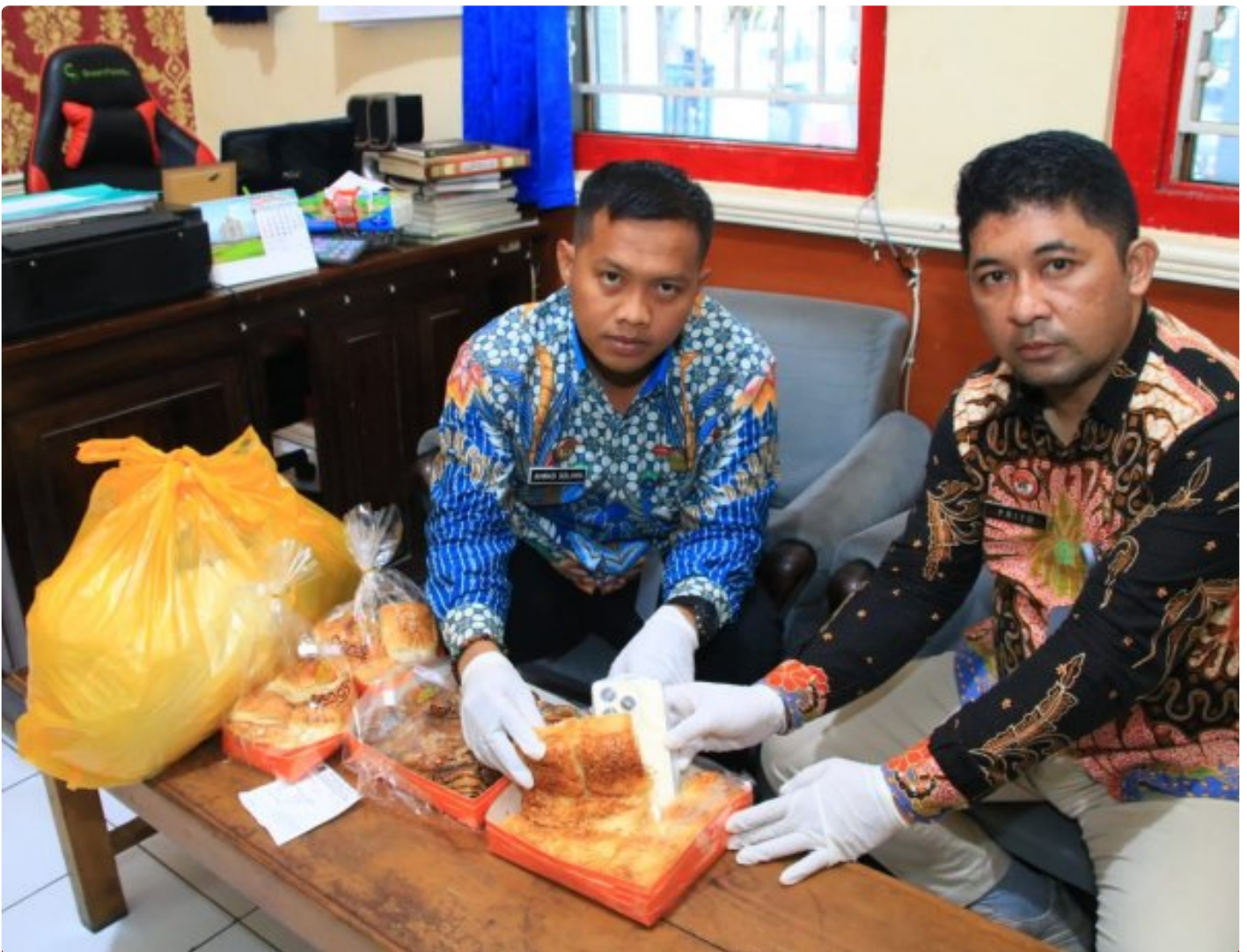
Petugas Lapas Banyuwangi berhasil menggagalkan penyelundupan HP ke dalam lapas

BANYUWANGI - Petugas Lembaga Pemasyarakatan (Lapas) Kelas IIA Banyuwangi berhasil menggagalkan upaya penyelundupan handphone ke salah satu narapidana, Sabtu (18/1/2025). Handphone itu akan diselundupkan oleh B kepada AL, seorang narapidana dengan perkara penyalahgunaan narkoba